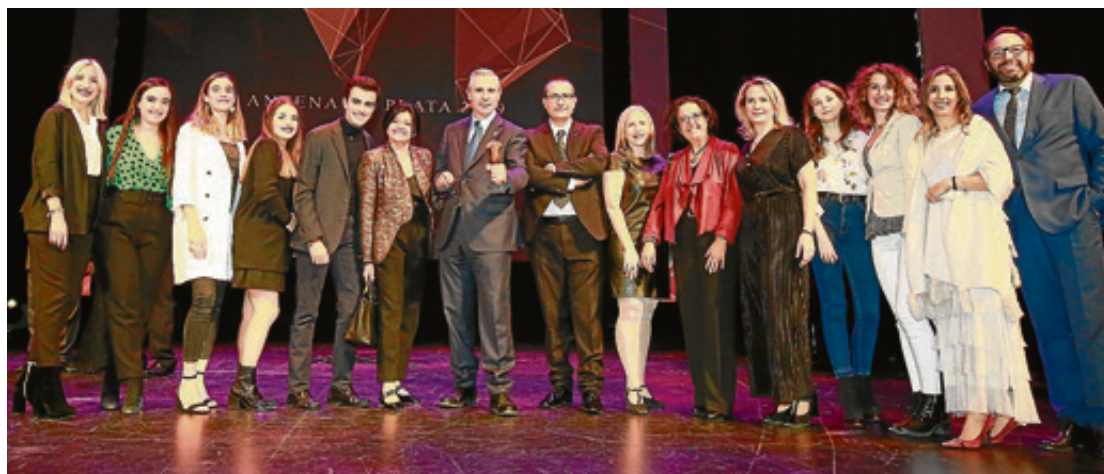
Alumnos y responsables de la Facultad con el presidente de la ARTV tras recoger el galardón.

1.715 alumnos. Actualmente imparte tres grados –Periodismo, Comunicación Audiovisual y Publicidad y Relaciones Públicas–, 9 posgrados, dos títulos de FP Superior y un programa de Doctorado. Además, ofrece a sus estudiantes un centenar de becas de intercambio con universidades europeas, y la posibilidad de llevar a cabo una movilidad internacional en más de 20 países de diferentes continentes.